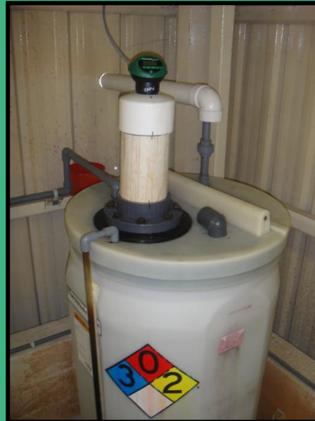
罐体液位测量 IMP Lite