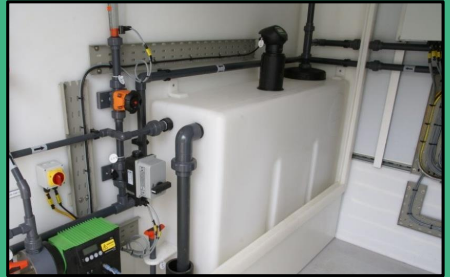
罐体液位测量-防爆型