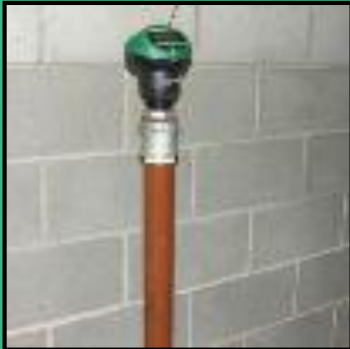
50mm 直径重油管道液位