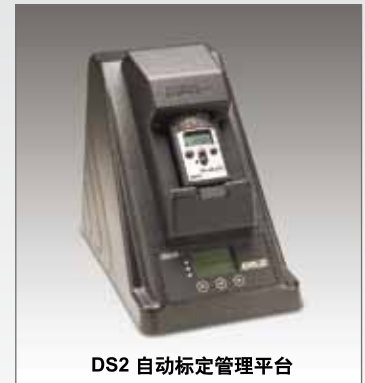
DS2 自动标定管理单元