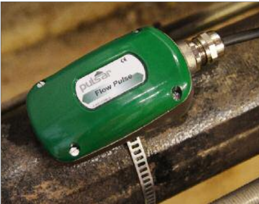
安装简单，在两个泵的污水泵站监测泵性能

Flow Pulse 是一个流量监测设备而非流量测量设备，在某些应用中其精度非常优秀，但有些情况精度取决于安装位置及应用环境。