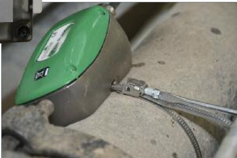
安装FLOW PULSE需要的工具: 1个螺丝刀

可选的FLOW MONITOR为FLOW PULSE提供电源, 编程, 报警, 以及流量记录等扩展功能。